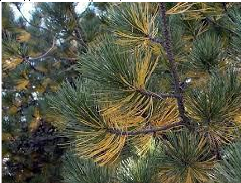
Рис. 3. Наявність некротичного ураження хвої сосни звичайної на території СЗЗ птахофабрики, 2021 р.

Мінімальне ушкодження хвої встановлене для дерев контрольної ділянки, на інших досліджуваних територіях було відмічено ушкодження хвої (рис. 3).