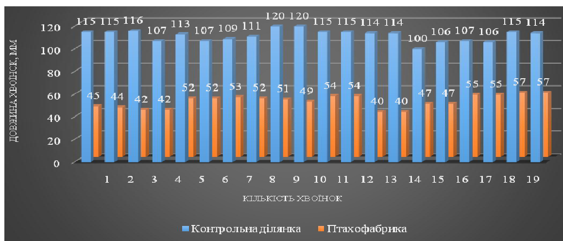
Рис. 1. Усереднені дані морфометричних показників сосни звичайної на території СЗЗ птахофабрики та контрольної ділянки, 2020 р.

Дослідженнями встановлено, що в більш забруднених районах пучки хвоїнок більш зближені, а їх кількість на 10 см пагона більша ніж в чистій зоні (рис. 1, 2).