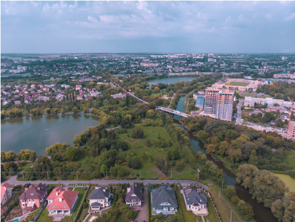
Рис. 1. Фотознімок системи водойм гідропарку м. Рівне [5]