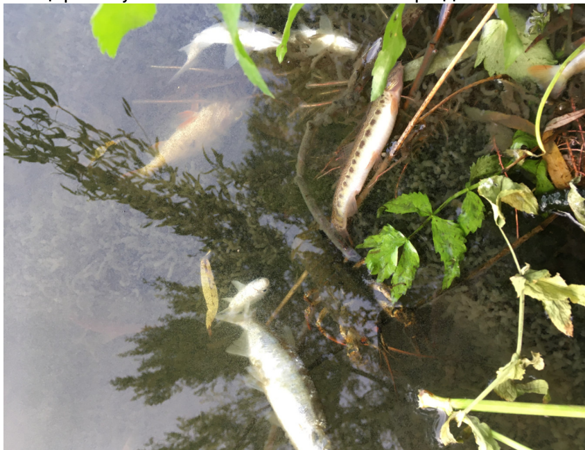
Рис. 3. Фотофіксація загибелі гідробіонтів, досліджувана перша штучна водойма гідропарку м. Рівне, 20.09.2020 р.

18–20 вересня увагу місцевого населення привернула поява загиблих особин іхтіофауни у першій штучній водоймі гідропарку (рис. 3). Це не перший випадок розвитку кризової ситуації у цій водоймі у 2020 році, однак за обсягами втрат іхтіофауни – наймасштабніша. Подібні кризові явища штучних водойм у місті Рівне спостерігаються щорічно у літньо-осінній межений період.