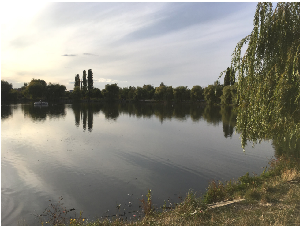
Рис. 2. Досліджувана перша штучна водойма міського гідропарку