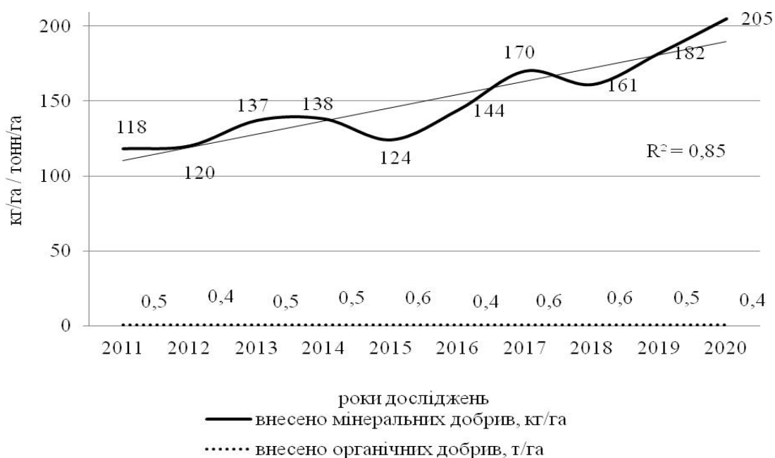
Рис. 2. Внесення мінеральних і органічних добрив під посіви сільськогосподарських культур

Співвідношення частки азотних добрив до фосфорних і калійних постійно зберігається на значеннях близьких як 1,0:0,2:0,2–0,23 з домінуванням у загальній кількості азотних мінеральних добрив масової частки аміачної селітри, як висококонцентрованого, швидкодіючого добрива з двома формами азоту. Для збалансування надходження в рослину та збереження запасів у ґрунті фосфору та калію, необхідно збільшити внесення фосфору у 3–4 рази і калію – у 5–6 разів. Позитивним моментом зростання внесення добрив, зокрема азотних, навіть за не зовсім сприятливого для рослин співвідношення між елементами живлення є те, що компенсується частина азоту, який був використаний мікроорганізмами з ґрунту при розкладі рослинних решток та сидератів без додаткового внесення азоту.